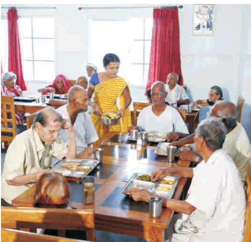
भोजन कक्ष का दृश्य