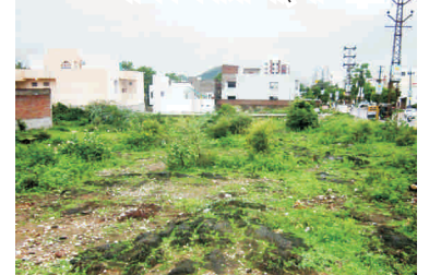
प्रस्तावित नवीन परिसर हेतु खरीदी गई जमीन