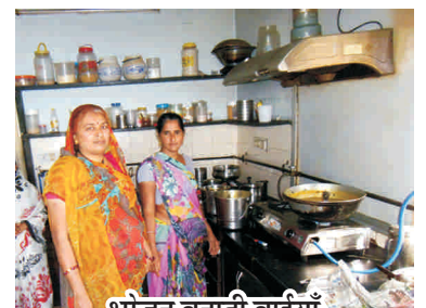
भोजन बनाती बाईयाँ