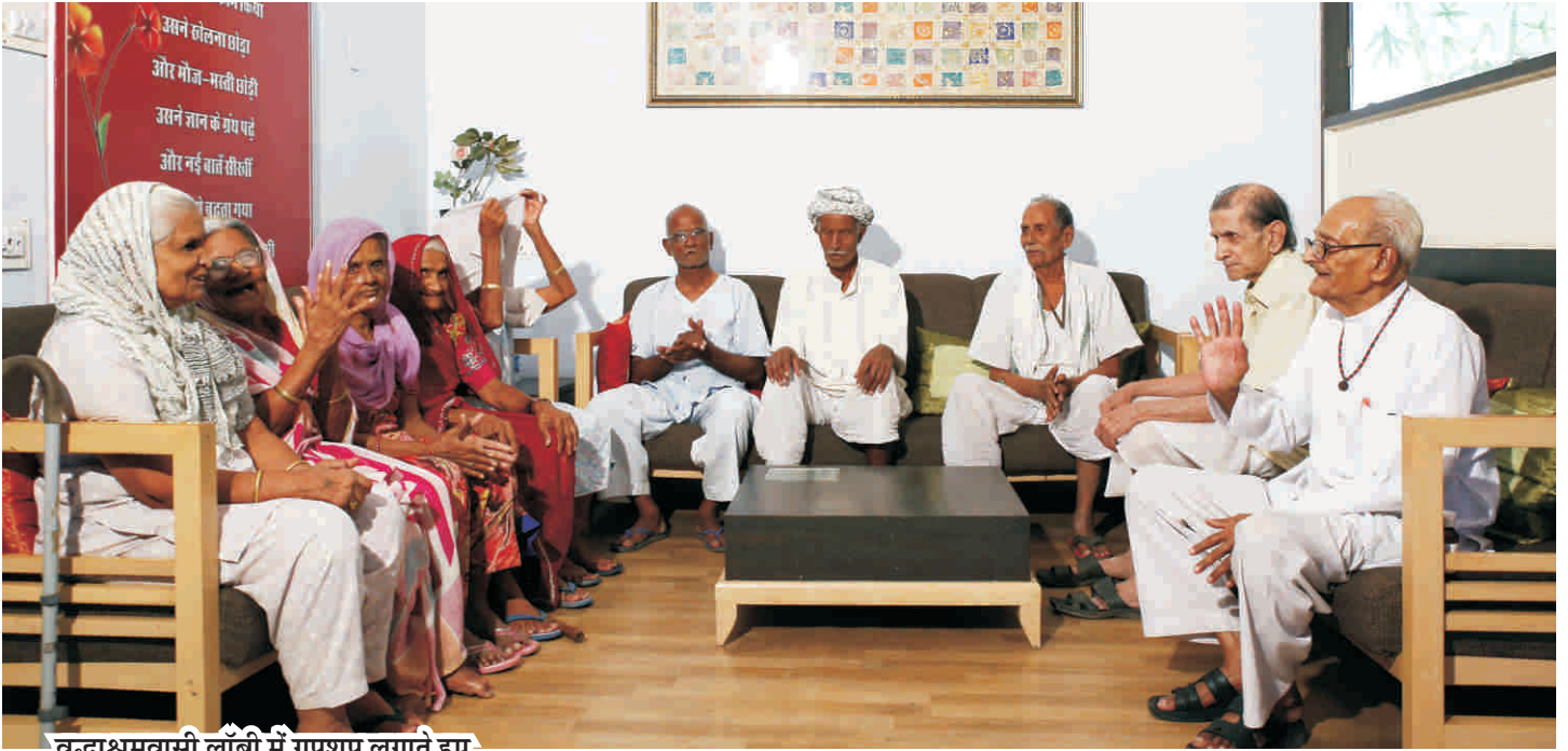
वृद्धाश्रमवासी लॉबी में गपशप लगाते हुए