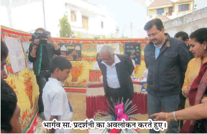
भार्गव सा. प्रदर्शनी का अवलोकन करते हुए।