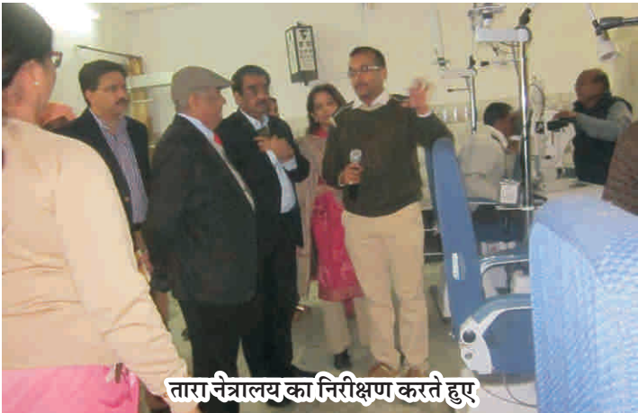
तारा नेत्रालय का निरीक्षण करते हुए