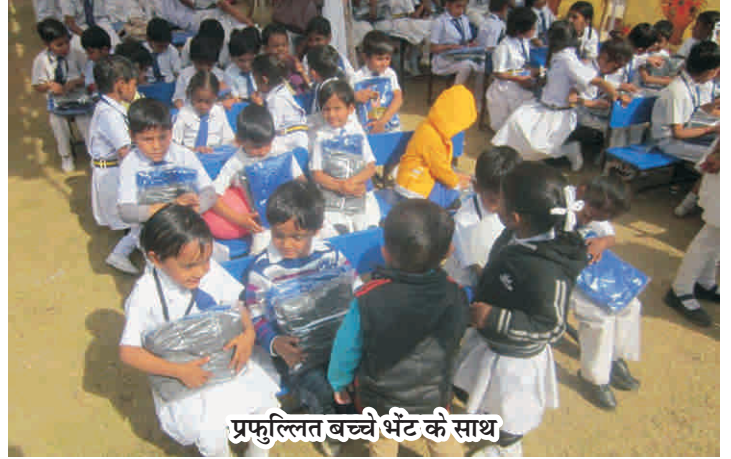
प्रफुल्लित बच्चे भेंट के साथ