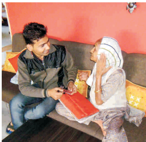
24 घंटे नर्सिंग सुविधा